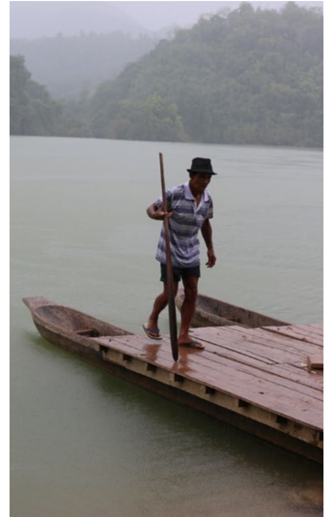
เมืองพันทอง แม่ น้ำปาง ลำสาขาของแม่น้ำสาละวินในรัฐฉาน, เมียนมาร์ พื้นที่นี้จะต้องจมอยู่ใต้น้ำหากมีการสร้างเขื่อนเมืองโตน

หน่วยงานธุรกิจต้องทำ “การตรวจสอบวิเคราะห์” ให้มีการปฏิบัติตามหลักการชี้ว่าแห่งสหประชาชาติ การตรวจสอบวิเคราะห์ เป็นทั้งมาตรฐานและกระบวนการ กำหนดให้ธุรกิจต้องดำเนินการเพื่อจำแนก ยุติหรือลดผลกระทบต่อสิทธิมนุษยชนที่มีต่อประชาชนในพื้นที่ และให้เยียวยาเมื่อเกิดผลกระทบขึ้นแล้ว เป็นกระบวนการที่ต้องเกิดขึ้นอย่างต่อเนื่องทั้งในเชิงรุกและเชิงรับ เพื่อให้สามารถประกันได้ว่าบริษัทเคารพสิทธิมนุษยชน และไม่มีส่วนทำให้เกิดความขัดแย้งขึ้น 44 การตรวจสอบวิเคราะห์เป็นส่วนหนึ่งของกระบวนการอย่างต่อเนื่อง และเป็นสิ่งที่สำคัญในพื้นที่ที่ได้รับผลกระทบจากความขัดแย้งเช่นเมียนมา ซึ่งอยู่ในจุดเริ่มต้นการเปลี่ยนผ่านสู่ประชาธิปไตยและกระบวนการสันติภาพ และไม่อาจคาดการณ์ได้ว่าจะเกิดความขัดแย้งขึ้นเมื่อใด