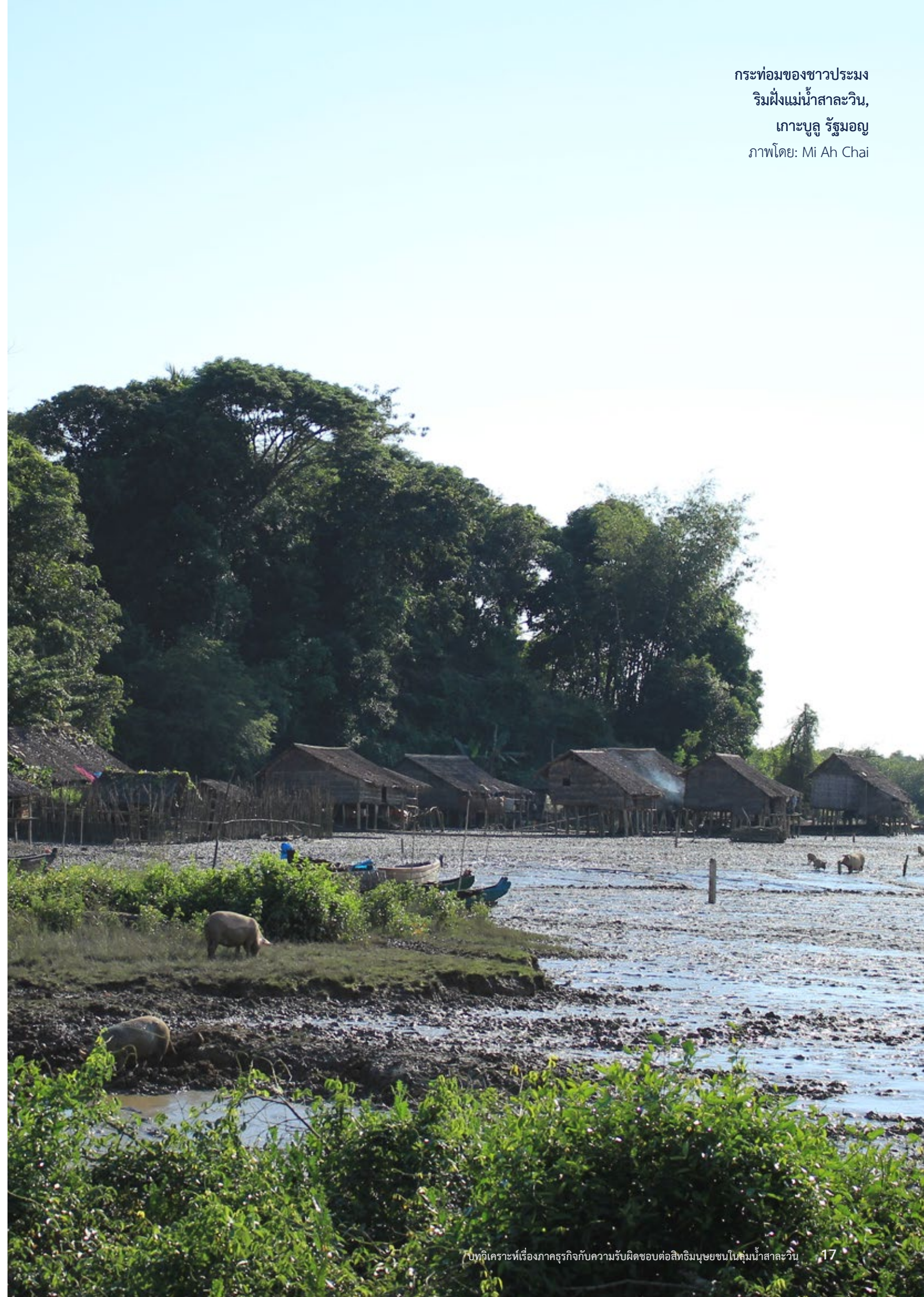
กระท่อมของชาวประมง ริมฝั่งแม่น้ำสาละวิน, เกาะบูลู รัฐมอญ