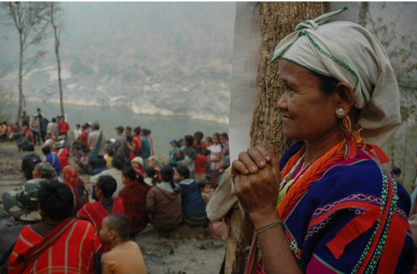
ชาวบ้านกลุ่มชาติพันธุ์กระเหรี่ยงและเครือช่ายต่าง ๆ จากไทยและเมียนมาร์ ร่วมกันภาวนาเพื่อให้แม่น้ำไหลอิสระในวันหยุดเชื่อมโลก

แนวปฏิบัติด้านอีไอเอยังกำหนดให้โครงการที่เกี่ยวข้องกับการโยกย้ายถิ่นฐานอย่างไม่สมัครใจ หรือโครงการที่อาจส่งผลกระทบต่อประชาชนพื้นเมือง ต้องปฏิบัติตามมาตรฐานระหว่างประเทศว่าด้วยการโยกย้ายถิ่นฐานโดยไม่สมัครใจ และประชาชนพื้นเมือง รวมทั้งนโยบายคุ้มครองของกลุ่มชนวนาคารโลกและธนาคารพัฒนาเอเชีย 55