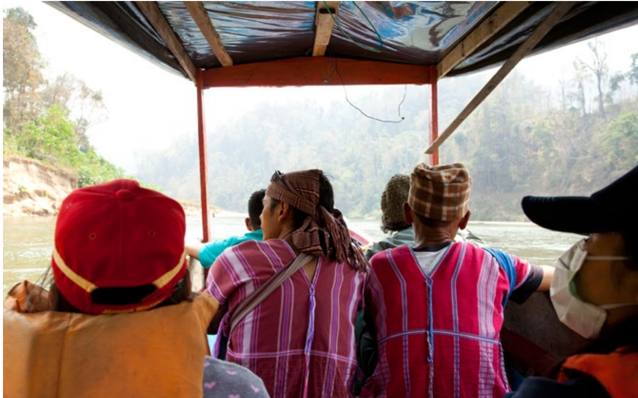
วันหยุดเขื่อนโลก, แม่น้ำสาละวิน