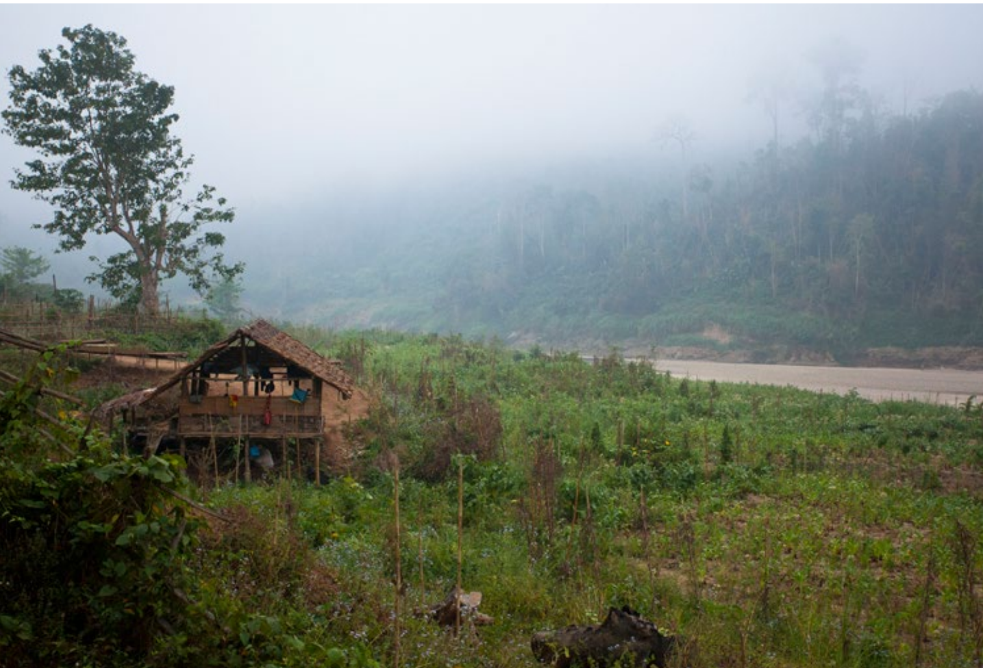
หมู่บ้านชนบทริมฝั่งแม่น้ำสาละวิน

กรอบพื้นฐานที่สำคัญได้แก่ หลักการลงทุนที่รับผิดชอบต่อสังคม หลักการเหล่านี้มีพื้นฐานจากความตระหนักว่า ประเด็นด้านสิ่งแวดล้อม สังคม และธรรมาภิบาล ส่งผลกระทบต่อ ภาพลักษณ์ของการลงทุนในระยะยาว และเป็นสิ่งที่นักลงทุนต้อง คำนึงถึงเพื่อให้สามารถปฏิบัติตามพันธกรณีของตนได้ การลงทุน อย่างรับผิดชอบต่อสังคมจะเกิดขึ้นเมื่อนักลงทุนเป็น “เจ้าของที่มีบทบาท เข้มแข็ง” โดยเข้าไปมีส่วนร่วมร่วมกับบริษัทที่พวกเขาลงทุน ในประเด็น ด้านสิ่งแวดล้อม สังคม และธรรมาภิบาล ยกตัวอย่างเช่น นักลงทุน ในโครงการสาละวินซึ่งมีแนวทาง “การลงทุนอย่างรับผิดชอบต่อสังคม” ต้องมีส่วนร่วมร่วมกับบริษัทที่จัดทำโครงการสาละวินในประเด็นด้าน สิ่งแวดล้อม สังคม และธรรมาภิบาล รวมทั้งความเสี่ยงที่เกี่ยวข้อง กับเขื่อน