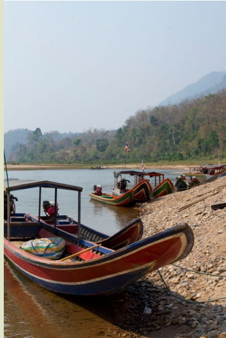
แม่น้ำเมย แม่น้ำสาขาสำคัญของแม่น้ำสาละวิน