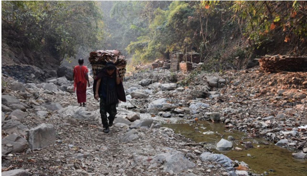
ผู้พลัดถิ่นภายในรัฐชาติพันธุ์ต่างๆ ของเมียนมาร์ ริมแม่น้ำสาละวินได้รับผลกระทบจากกองกำลังทหารและการละเมิดสิทธิมนุษยชน

ไม่เป็นที่ชัดเจนว่า ผู้มีส่วนได้ส่วนเสียด้านธุรกิจในกลุ่มน้ำสาละวิน รายใด ได้ทำการตรวจสอบวิเคราะห์อย่างสอดคล้องตามหลักการ ชี้นำแห่งสหประชาชาติข้อ 17–21 จึงควรให้ความสนใจเป็นพิเศษว่า ผู้มีส่วนได้ส่วนเสียด้านธุรกิจในกลุ่มน้ำสาละวินได้ประเมินและลดผลกระทบด้านสิทธิมนุษยชนของกองทัพเมียนมา ซึ่งมักทำหน้าที่ รักษาความปลอดภัยในพื้นที่เขื่อนอย่างไร เนื่องจากพวกเขามีส่วน เกี่ยวข้องกับผู้มีส่วนได้ส่วนเสียด้านธุรกิจในกลุ่มน้ำสาละวินทั้งในแง่ การดำเนินงาน ผลลัพธ์ หรือบริการของตน บริษัทไม่จำเป็นต้อง ประเมินอย่างครอบคลุมต่อสิทธิด้านสิทธิมนุษยชนโดยทั่วไปของ กองทัพเมียนมา แต่ต้องประเมินความเสี่ยงที่อาจเกิดการปฏิบัติ มิชอบขึ้น อันเป็นผลมาจากการตั้งฐานทัพในหรืออยู่ใกล้พื้นที่ สร้างเขื่อน การประเมินควรครอบคลุมประเด็นที่เกี่ยวข้องดังนี้