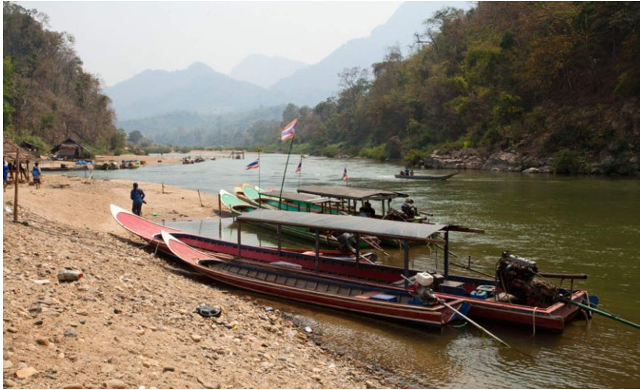
แม่น้ำเมย แม่น้ำสาขาสำคัญของแม่น้ำสาละวินซึ่งไหลจากประเทศไทย

กฎหมายเมียนมายังยอมรับหลักการสิทธิมนุษยชนและสิทธิเชิงขั้นตอนปฏิบัติที่สำคัญหลายประการ รวมถึงกรอบกฎหมายว่าด้วยการประเมินผลกระทบด้านสิ่งแวดล้อม การเวนคืนที่ดินและการจัดสรรที่อยู่ใหม่ และการลงทุน