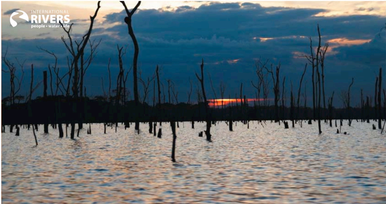
Árboles muertos en el embalse de la represa Balbina