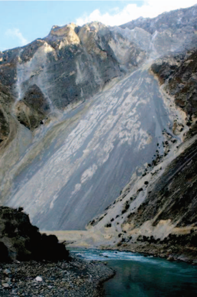
ခါတ်ပုံ- ရေကာတာတည်ဆောက်ရေးနှင့် ယင်းနှင့်စပ်လျဉ်းသည့် လုပ်ဆောင်ချက်များသည် သဘာဝပတ်ဝန်းကျင် ထိခိုက်နစ်နာမှုကို ပိုမိုဆိုးရွားစေနိုင်သည်။

အပြိုင်စီးဆင်းနေသော ဤကမ္ဘာ့အမွေအနှစ်ဒေသသည် အပင်အမျိုး ပေါင်း ၇၀၀၀ နှင့် ရှားပါးသော (သို့မဟုတ်) မျိုးပြုန်းလုနီးပါးဖြစ်နေသော တိရစ္ဆာန်အမျိုးပေါင်း ၈၀ ကျော်တို့၏ နေ အိမ်ဖြစ်သည်။ UNESCO ၏ အဆိုအရ ကမ္ဘာ့တိရစ္ဆာန်ဦးရေ၏ ၂၅ ရာခိုင်နှုန်းကျော် နှင့် တရုတ်နိုင်ငံ၏ တိရစ္ဆာန် ဦးရေ ၅၀ ရာခိုင်နှုန်းကျော်တို့ ကို ထောက်ပံ့မှုပေးနေသည်ဟု ယုံကြည်ကြသည်။ ဤဒေသသည် ယဉ်ကျေးမှုအမျိုးမျိုး ထွန်းကားသည့် ဒေသအဖြစ် အမည်ကျော်ကြားသည်။ ယူနန်ပြည်နယ်အတွင်းတွင် ဤရေလက်ကြားသည် အဓိက အားဖြင့် စိုက်ပျိုးရေးဖြင့် အသက်မွေးဝမ်းကြောင်းကြသော တိုင်းရင်းသားလူမျိုးပေါင်း ၁၃ မျိုး၊ ဦးရေ ငါးသန်းကျော် တို့ မှီတင်းနေထိုင်ကြသော နယ်မြေဖြစ်သည်။