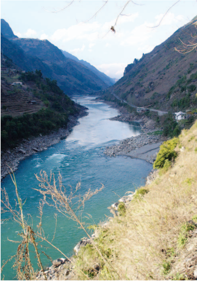
မဲင်္ဂါနာလးဝါမ်ပဲလ်တလ္လမ္ပုဏ (ဂါဖါထေ Pai D.)

မယ်ဟောင်ဆောင်ခရိုင်အတွင်းရှိ သောင်းနှင့် ချီသော နေအိမ်များ ပိုမိုရွှေ့ပြောင်းခြင်းခံရမည်ဟု သုံးသပ်ထားသည်။ အခြားလူများမှာ တာဆန်းရေကာတာဆောက်လုပ်ရေးအတွက် ကြိုတင်ပြင်ဆင်သည့်အဆင့်များမှစ၍ မြန်မာတပ်မတော်၏ အစုအဖွဲ့ လိုက် အတင်းအဓမ္မ လုပ်အားခိုင်းစေခြင်း၊ မုဒိမ်းကျင့်ခြင်းနှင့် သတ်ဖြတ်ခြင်းတို့ကို ခံလာခဲ့ရ သည်။ ဇွန်လ ၂၀၁၁ ခုနှစ် ရေကာတာအနီးတွင် ဖြစ်ပွားခဲ့သော တိုက်ပွဲသည် တရုတ်နိုင်ငံ၏ ဘဏ္ဍာရေးထောက်ပံ့မှု ရရှိထားသော အခြား ရေကာတာ တည်ရှိသည့် ဒေသများအထိပါ ပျံ့နှံ့သွားသည့်အတွက် ဒုက္ခသည် ၂၀၀၀ ကျော် တရုတ်နိုင်ငံနယ်စပ်သို့ ထွက်ပြေးလာခဲ့ရသည်။ ရှာသားတဦးက “ကျွန်တော်တို့ကို ထွက်သွားဖို့အတွက် ခြိမ်းခြောက် ခဲ့သော်လည်း ကျွန်တော်တို့မှာ ဘယ်ကို သွားပြီး ဘယ်လိုဆက်လက်ရှင်သန်ရမယ်ဆိုတာကို မသိဘဲ ဖြစ်နေပါတယ်” ဟု ထုတ်ဖော်ပြောဆိုခဲ့သည်။