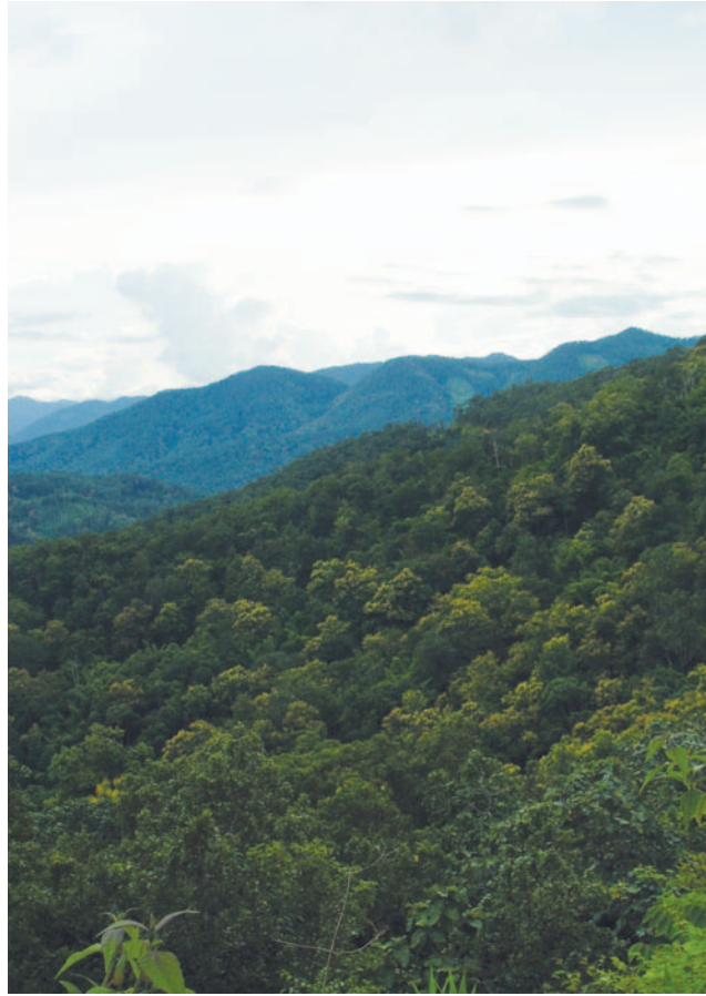
ပိမ်ပါနာလးဝါမ်ဗေယျာထေပိထေ-ဖမော ဝုထမ်ပဲထံသမ်ပဲဒိတ် ဗဲလးပိမ်ပိမ် ပိမ်ပိမ်ဒိတ် ဗဲလးပိမ်ပိမ် (ဂါဖါထေ Pai D.)

တရုတ်နိုင်ငံအတွင်းရှိ သံလွင်မြစ်အပေါ်တွင် တည်ဆောက်မည့် ရေကာတာများသည် တရုတ်နိုင်ငံ အနောက်ပိုင်း ဒေသ ဖွံ့ဖြိုးတိုးတက်ရေးဗျူဟာ၏ အစိတ်အပိုင်းဖြစ်ပြီး ဤအစီအစဉ်ဖြင့် အနောက်ပိုင်းဒေသမှ ထုတ်လုပ်သည့် လျှပ်စစ်စွမ်းအင်များကို အရှေ့ပိုင်းဒေသများသို့ ပို့ဆောင်ရန်အတွက်ဖြစ်သည်။ သို့သော် ကျွမ်းကျင်သူများမှ ရေကာတာ များတည်ဆောက်ခြင်းဖြင့် တရုတ်နိုင်ငံအတိုင်း စွမ်းအင်ကိုအခြေခံသည့် စက်မှုလုပ်ငန်းများကို ပိုမိုတိုးပွားလာစေရန် တွန်းပို့ပေးခြင်းနှင့် ဒေသအတွင်းရှိ ပေါများသော သဘာဝသယံဇာတများကို ထုတ်ယူသုံးစွဲခြင်းများ ပိုမိုများပြားလာ မည်ကို