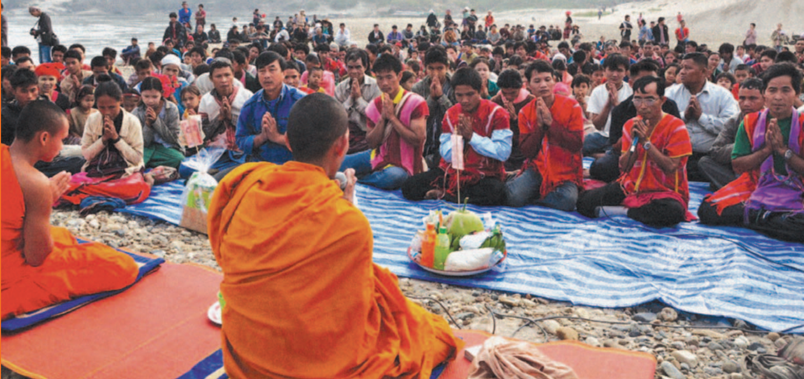
ရုပ်ပုံ။ ။ ထိုင်း-မြန်မာ နယ်စပ်ရှိ ရွာသူရွာသားများ စုပေါင်း၍ သံလွင်မြစ်ပူဇော်ခြင်း နှင့် သံလွင်ရေကာတာကြီး တည်ဆောက်ခြင်းကို ဆန့်ကျင်ခြင်း