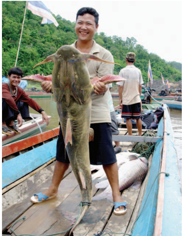
ခါတ်ပုံ- ထိုင်း-ကရင် တံငါသည်တစ်ဦးမှ ဖမ်းဆီးရရှိထားသော ငါးကို ပြသခြင်း

ဤစီမံကိန်းကို ဝေဖန်ကြသောသူများ၏ အဓိက စိုးရိမ်ပူပန်မှုမှာ စီမံကိန်း၏ ---- အန္တရာယ်ပင်ဖြစ်သည်။ သံလွင်မြစ်သည် အရှေ့မြောက် အိန္ဒိယကုန်းတွင်းပိုင်းဒေသနှင့် ယူရေးရှားကုန်းတွင်းပိုင်းဒေသနှစ်ခုအကြားတွင် တည်ရှိသည်။ ၁၂ ခုမြောက် ၅ နှစ်စီမံကိန်းတွင် ပါဝင်သော လုပ်ငန်းစဉ်အများစုသည် ကြီးမားသော မြေအက်ကြောင်းပေါ်တွင် တည်ရှိနေပြီး ထိုဒေသသည် တရုတ်နိုင်ငံ၏ မြေလျင်လှုပ်ရှားမှုအများဆုံးရှိသော နယ်မြေဖြစ်သည်။ ၁၅၁၂ ခုနှစ်မှ ၁၉၇၆ ခုနှစ်အတွင်း သံလွင်မြစ်၏ ဤနောက်ပိုင်းဒေသတွင် အဆင့် ၆ သို့မဟုတ် အဆင့် ၆ ထက် ပြင်းထန် သော မြေလျင်လှုပ်ရှားမှု ၁၅ ကြိမ်ဖြစ်ခဲ့သည်။ တနည်းဆိုရာသော အနှစ် ၃၀ တွင် တကြိမ်နှုန်းဖြစ်ပွားခဲ့သည်။ ၂၀၀၈ ခုနှစ်တွင် ဖြစ်ပွားခဲ့သော ရာချီသော ရေကာတာ များကို ပျက်စီးစေခဲ့သော ရေလှောင်တံခံ၏ ပရောဂျက်ကြောင့် ဖြစ်ပွားခဲ့နိုင်ဖွယ်ရှိသော စီချွမ်ပြည်နယ် မြေလျင်လှုပ်ရှားမှုသည် (ရေလှောင်တံခံကြောင့်ဖြစ်ပွားသည့် မြေလျင် လှုပ်ရှားမှု) မြေအက်ကြောင်း