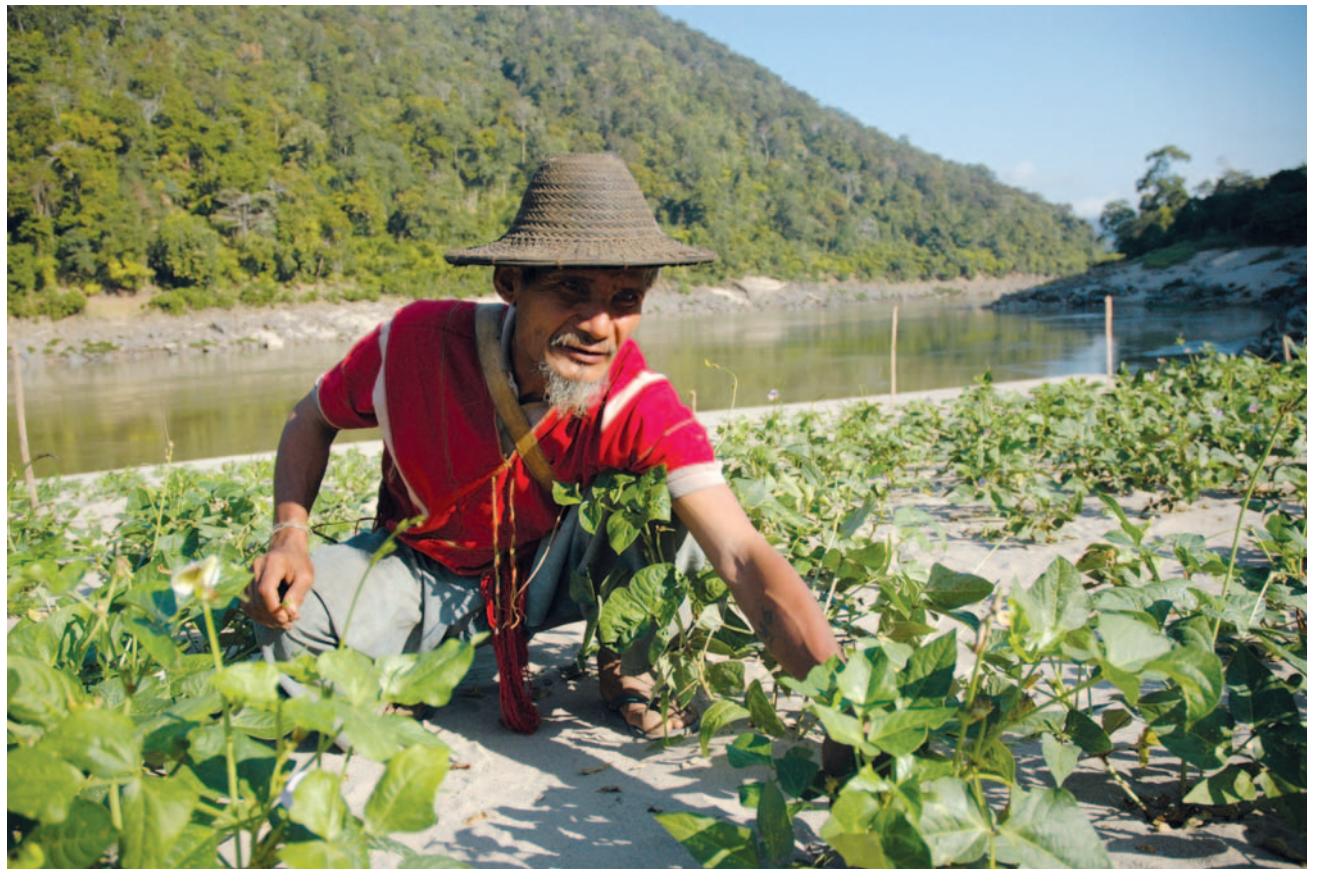
เกษกรสิรมน้ำสะอาด เป็นความมั่นคงทางอาหารของชุมชนสองฝั่งน้ำตกตฤแล้ง

လက်ရှိ အရေးပါသည့် သံလွင်မြစ်ကြီးပေါ်တွင် ဆောက်လုပ်မည့် ရေအားလျှပ်စစ်စီမံကိန်းဆိုင်ရာ မူဝါဒများအပါအဝင် တရုတ်နိုင်ငံအတွင်းရှိ ကြီးမားသည့်ရေကာတာ ဖွံ့ဖြိုးရေးများနှင့်ပတ်သက်၍ ထပ်မံစဉ်းစားသုံးသပ်ခြင်းများကို ကျယ်ပြန့်စွာ ပြုလုပ်နေသည်။ မကြာသေးခင်က ရပ်ဆိုင်းခဲ့သည့် ရေဝတီမြစ်တွင် ဆောက်လုပ်မည့် မြစ်ဆုံရေကာတာ စီမံကိန်းနှင့် လူထုအခြေပြုလူ့အဖွဲ့အစည်းများ၏ ပွင့်လင်းစွာဆွေးနွေးနိုင်မှုများ တဖြည်းဖြည်းနှင့်ဖွင့်ပေးလာခြင်းတို့ သည် မြန်မာနိုင်ငံတွင် ပြောင်းလဲမှုများကို ဖော်ဆောင်နိုင်သည့် လက္ခဏာရပ်များပင်ဖြစ်သည်။ ယခင်က ဖြစ်ပျက်ခဲ့ သည့် သံလွင်ရေကာတာဆောက်လုပ်မှုရပ်တန့်ရေးနှင့်ပတ်သက်သည့် နိုင်ငံတကာ စည်းရုံးလှုံ့ဆော်ရေး၏ ဗအာင် မြင်မှုကိုကြည့်ခြင်းအားဖြင့်လည်း ဩဇာအာဏာပြည့်ဝသူများမှ စီမံကိန်းဖြစ်မြောက်ရေးအတွက် များစွာ တိုက်တွန်း ခဲ့သော်လည်း နိုင်ငံခေါင်းဆောင်များသည် အများပြည်သူတို့၏ ဖိအားပေးမှုများအပေါ် တုန်ပြန်မှုရှိနေသည်မှာ ပေါ် လွင်နေသည်။ ဤစီမံကိန်းများမှ ဖြစ်ပေါ်လာမည့် သက်ရောက်မှုများနှင့်ပတ်သက်သည့် ပွင့်လင်းသည့် ဆွေးနွေး ဖလှယ်မှုများကို မြှင့်တင်ခြင်းဖြင့် အာရှ၏ အရေးပါသည့် အသက်သွေးကြောတခုကို ထိန်းသိမ်းနိုင်မည်ဖြစ်သည်။