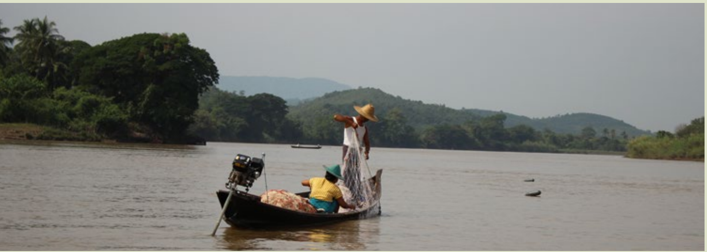
မွန်ပြည်နယ် ပေါင်မြို့နယ်၌ မွန်မိသားစုတစ်စု သံလွင်မြစ်အတွင်း ငါးဖမ်းနေပုံ